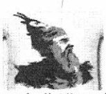
Piana degli Albanesi